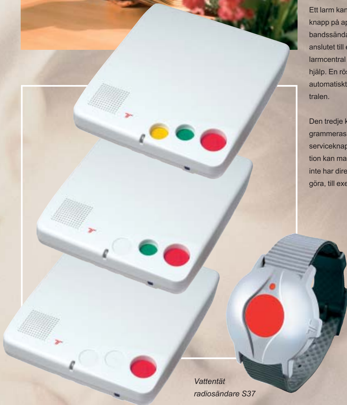
Vattentät radiosändare S37

Den tredje knappen kan antingen programmeras för på-/avanmälan eller som serviceknapp. Med denna servicefunktion kan man även beställa tjänster som inte har direkt med larmfunktionen att göra, till exempel i servicebostäder.